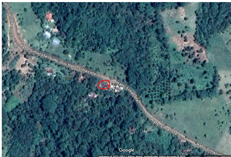
Vereda Paramito